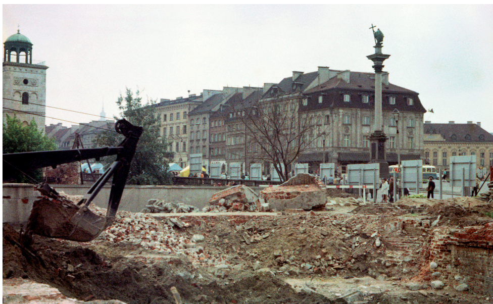
Ryc. 6. Badania wykopaliskowe na terenie Zamku Królewskiego w Warszawie w 1971 roku (klisza nr M/17226)

ologicznych na terenie ówczesnych województw: bydgoskiego, białostockiego, leszczyńskiego, suwalskiego i tarnobrzeskiego. Pracownicy PMA brali udział w wykopaliskach na terenie Zamku Królewskiego w Warszawie (Ryc. 6). Przeprowadzono badania ratownicze na dziedzińcu Arsenалу Warszawskiego (po raz pierwszy w jego historii) oraz w Karolewie (powiat gostyniński), Warszawie Zbytkach i Starogrodzie (powiat miński). W 1982 roku PMA włączyło się do programu badań Archeologicznego Zdjęcia Polski (AZP) 39 , a w roku następnym przystąpiło do interdyscyplinarnego zespołu badającego kryteria odrębności gatunkowej człowieka. Zespół działa do dziś w ramach międzynarodowej grupy „Interevolutia” z siedzibą w Pradze, a jego sekretariat znajduje się w PMA.