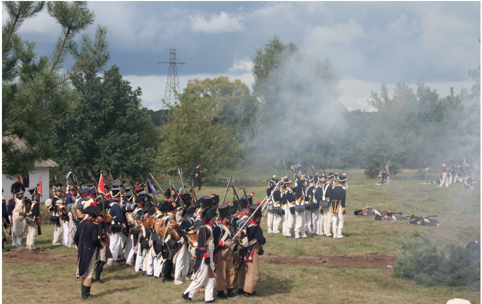
Ryc. 13. Inscenizacja widowiska historycznego Noc Listopadowa – zdobycie Arsenалу Warszawskiego.