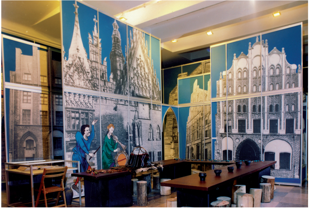
Ryc. 19. Stanowisko do prowadzenia lekcji muzealnych na ekspozycji wystawy ABC architektury gotyku.