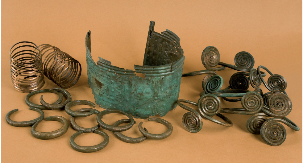
Ryc. 1. „Skarb” z Dratowa, powiat puławski. Od lewej: bransolety otwarte, bransolety wielozwojowe, diadem z blachy brązowej, naramienniki (1400-1300 roku p.n.e.) Zbiory PMA.

współpracowali z PMA archeolodzy i konserwatorzy zwani delegatami, którzy prowadzili prace ratunkowe, zbierali wiadomości o stanowiskach archeologicznych i przesyłali informacje o nich do muzeum w celu dokonania rejestracji. Czuwali także nad przypadkowymi odkryciami, starając się pozyskać je dla PMA; w ten sposób trafił do zbiorów unikatowy „skarb” 8 z Dratowa (powiat puławski) – Ryc. 1. Rozpoczęto także badania 9 wykopaliskowe i powierzchniowe.