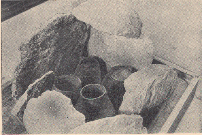
Grób skrzynkowy znaleziony w Starej Wsi w p. błońskim z czasu ok. 500 l. przed Chr. Obecnie w Państwowym Muzeum Archeologicznym w Warszawie, ul. Agrykola nr 9.

Ryc. 2a i 2b. Karta pocztowa wydana przez Stowarzyszenie Przyjaciół PMA, a – fragment wystawy otwartej w 1931 roku (grób skrzynkowy z ok. 500 roku p.n.e.), b – tekst reklamujący Stowarzyszenie. Zbiory PMA