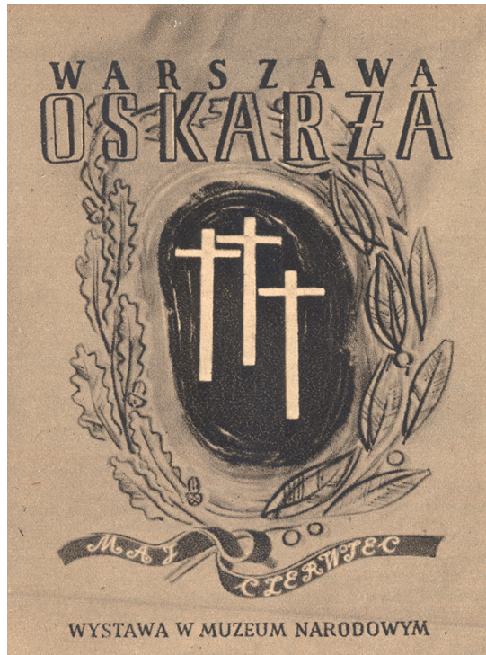
Ryc. 3. Plakat wystawy Warszawa oskarża