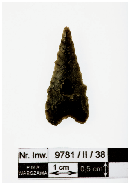
Ryc. 14. Grocik sercowaty krzemienisty z wczesnej epoki brązu (III/II tysiąclecie p.n.e.) Zbiory PMA. Fot. R. Sofuł