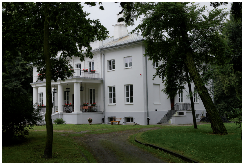
Ryc. 4. Pałac w Rybnie – siedziba ośrodka magazynowo-studyjnego PMA.

W listopadzie 1964 roku PMA protokolarnie przejęło, uznaną za zabytek 35 , „pozostałość dworu klasycystycznego z parkiem 36 krajobrazowym” w Rybnie [Bender 1997]. Po jego odbudowie i adaptacji stał się Oddziałem PMA o charakterze magazynowo-studyjnym ( Ryc. 4 ). Od 1968 roku kolejnym Oddziałem PMA na mocy zarządzenia Ministra Kultury i Sztuki