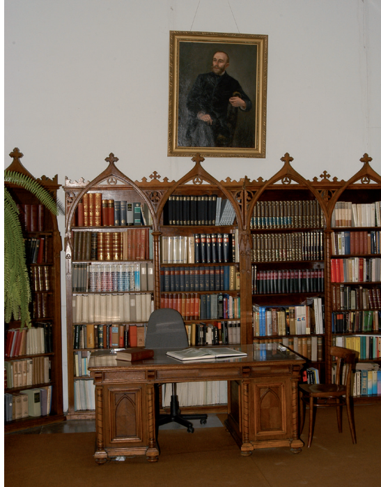
Ryc. 20. Biblioteka PMA – księgozbiór podręczny w zabytkowym regale bibliotecznym (koniec XIX wieku– początek XX wieku), na ścianie portret Erazma Majewskiego.