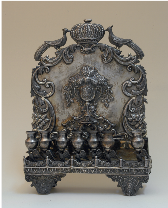
Ryc. 5. Lampa chanukowa, srebro (ok. II poł. XIX w.). Zbiory PMA.