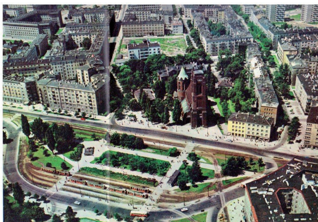
Ryc. 12. Plac Narutowicza w latach 70. XX w.