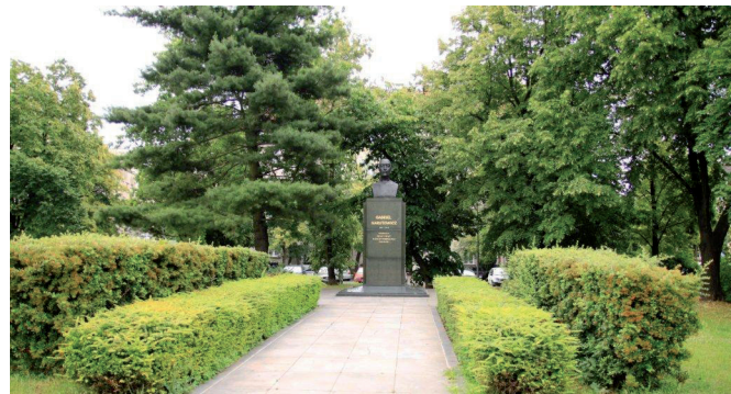
Ryc. 18. Popiersie prezydenta Gabriela Narutowicza