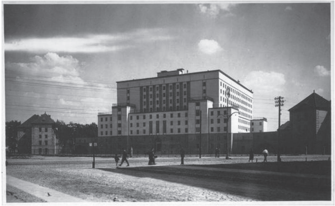
Ryc. 5. Gmach „Akademika”

w jego kształt, stanął budynek projektu Zygmunta Tillingera, wybudowany w latach 1927-29 (Ryc. 6.). Ten monumentalny gmach, z wciętym półkoliście frontem i portalem o 4 ko-lumnach, był wówczas najnowocześniejszym domem mieszkalnym w Warszawie [Faryna-Paszkiewicz, 1995, 176]. W skład kompleksu domów dochodowych dawnej Pocztowej Kasy Oszczędności wchodził także sąsiedni budynek z 1926 r. (ul. Filtrowa 68) – imponujący, z efektowną elewacją i dekoracją rzeźbiarską 3 [Móravski, Głębocki, 1996, 349; Kasprzycki, 1999, 129].