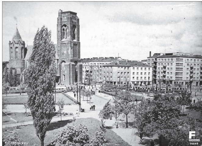
Ryc. 10. Widok na plac w trakcie odbudowy, 1947 r. Na pierwszym planie – zachowany regularny szpaler topól przed wejściem do Domu Akademickiego