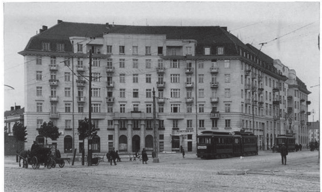
Ryc. 6. Dom mieszkalny Z. Tillingera