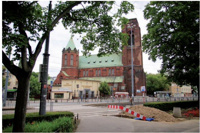
Ryc. 17. Gmach kościoła i „zgrzyt” architektoniczny od strony południowej

Wyróżniającą się formą zagospodarowania placu jest drzewostan. Występuje on zarówno w części centralnej – na obszarze pętli tramwajowej, jak i w części południowo-wschodniej – wzdłuż ul. Akademickiej. Wykonana w 2012 roku inwentaryzacja dendrologiczna [Szczegółowa inwentaryzacja-