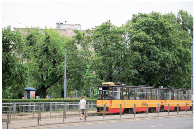
Ryc. 21. Zadrzewienia w centralnej części placu. W głębi gmach „Akademika”