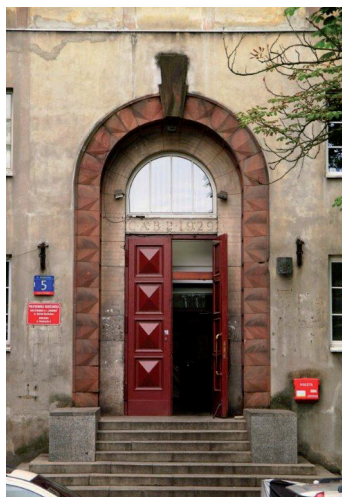
Ryc. 16. Detal architektoniczny – wejście główne do gmachu „Akademika”