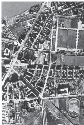
Ryc. 1. Pl. Narutowicza w szerszym kontekście przestrzennym – stan przed 1939 r.

Plac usytuowano „frontem” do ul. Grójeckiej i wyprowadzono stąd istniejące już ul. Filtrową oraz ul. Barską po stronie zachodniej oraz nowoprojektowane – ul. Uniwersytecką i niewielką ul. Supińskiego. Wewnętrzna ul. Akademicka niejako zamknęła plac, otaczając go łukiem od strony wschodniej. Półkolistą formę placu wzmocniło powtórzenie kształtu ulicą Mochnackiego na drugim planie. W kontekście powiązań przestrzennych i widokowych główny trzon kompozycji stanowiły ulice Filtrowa i Uniwersytecka, skoncentrowane na głównej dominancie placu – kościele pw. Niepokalanego Poczęcia Najświętszej Marii Panny (Ryc. 1., Ryc. 2.). Szczególną rolę wyznaczono ul. Uniwersyteckiej – miała stanowić główną arterię łączącą Ochotę z Mokotowem, biegnąc przez Pole Mokotowskie aż do planowanej Al. Niepodległości