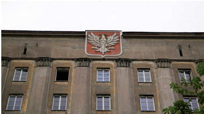
Ryc. 15. Gmach „Akademika” – zwieńczenie elewacji frontowej; godło (orzeł bez korony) umieszczone po 1945 r.

W sąsiedztwie placu Narutowicza znajdują się obszary i obiekty wpisane do rejestru zabytków: układ urbanistyczny Kolonia Lubeckiego, zespół urbanistyczno-architektoniczny Reduta Wawelska. W bezpośrednim otoczeniu placu, ze względu na swoje wartości