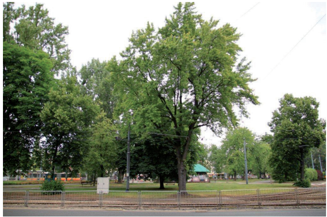
Ryc. 20. Zadrzewienia w centralnej części placu

Równoległe wzdłuż tego fragmentu ul. Akademickiej rośnie 13 drzew w bardzo dobrym stanie zdrowotnym. Dominuje tu lipa drobnolistna (9 szt., obwód ok. 100 cm), a towarzysząco występuje jarzab mączny (4 szt., obwód ok. 70 cm). W sąsiedztwie ulicy wskazać można jedynie 5 drzew w pogorszonym lub złym stanie zdrowotnym.