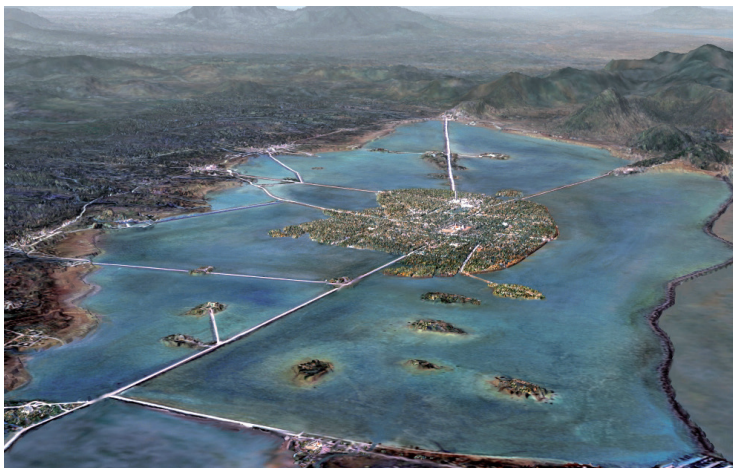
Ryc. 12. Jezioro Texcoco z czasów Netzahualcoyotla – rekonstrukcja