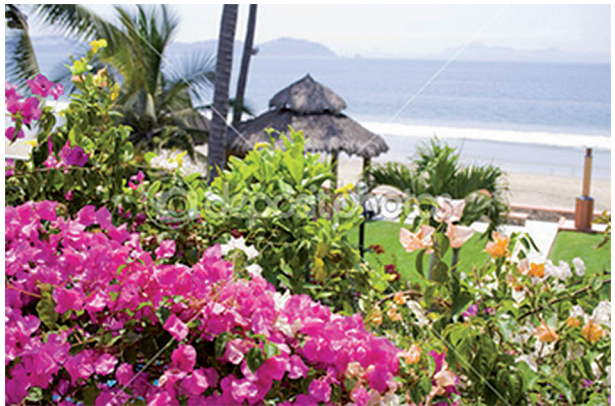
Ryc. 16. Ogrody Texcoco

I pośród wspaniałej, bujnej tropikalnej roślinności, nie dodatkowo, ale jako pierwszoplanowe działanie, zatknięto srebrzyste roze-ty Agawy ( Agave americana var. marginata ) ze złożonymi brzegami liści, usłano poletka złotymi pręcikami, nabijanymi turkusem Mięty meksykańskiej ( Agastache mexicana ) i Komosy Quinoa ( Chenopodium Quinoa ), z ametystowymi kolbami, która karmiła ludzi w czas głodu.