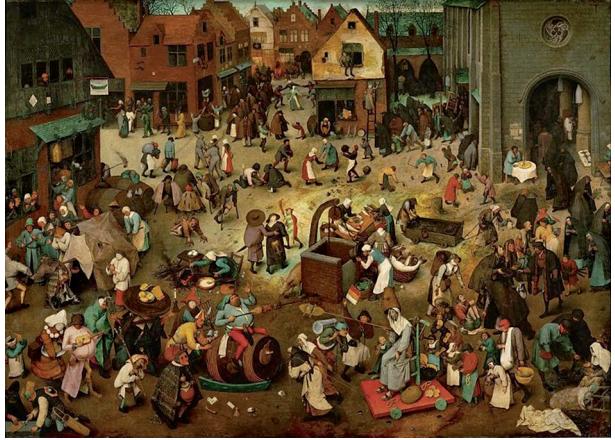
Ryc. 3. Sceny z życia codziennego w późnym średniowieczu. Obraz Piotra Bruegela Starszego.

Źródło: Pieter Bruegel, Walka karnawału z postem, 1559, olej na desce, Wiedeń – http://glebiaobrazu.blogspot.com/