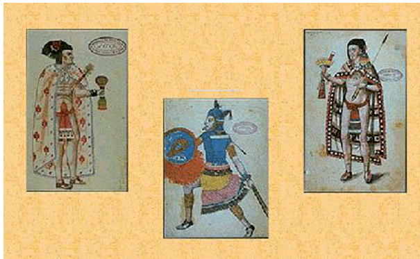
Ryc. 14. Netzahualcoyotl na przedstawieniach współczesnych