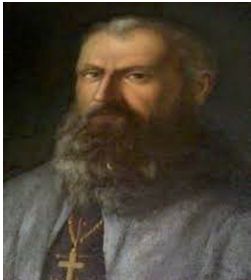
Ryc. 8. Biskup Aleksander z Malonne – portret z pocztu biskupów płockich.