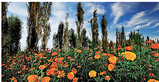
Ryc. 15. Ogrody Texcoco