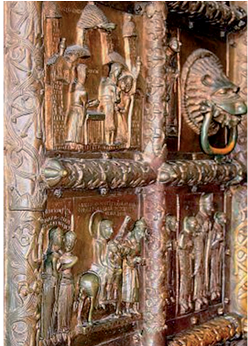
Ryc. 10. Bordiura drzwi płockich