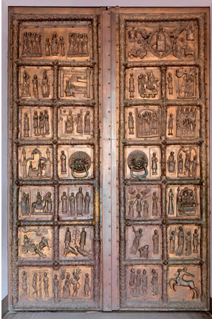
Ryc. 9. Drzwi Płockie, kopia: widok obydwu skrzydeł