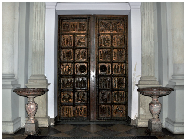
Ryc. 1. „Drzwi Płockie” – kruchta katedry płockiej