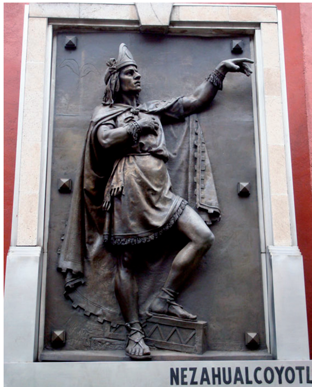
Ryc. 11. Pomnik Netzahualcoyotla – Płaskorzeźba z brązu w Mexico City