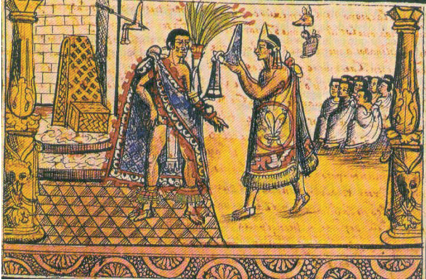
Ryc. 13. Netzahualcoyotl wręcza nagrodę zwycięzcy konkursu poetyckiego w Texcoco