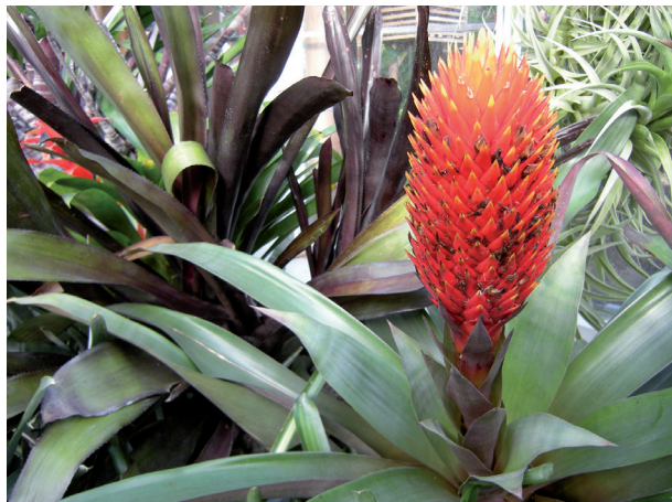
Ryc. 18. Aechmea calyculata – kwiaty z ogrodów Netzahualcoyotla