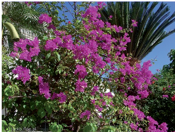
Ryc. 2. Ogrody Texcotzinko