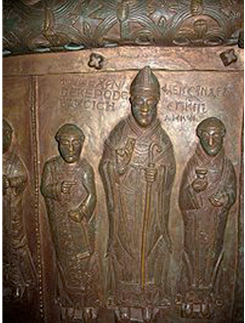
Ryc. 7. Wizerunek biskupa Aleksandra z Malonne na kopii Drzwi Płockich

Źródło: https://pl.wikipedia.org/wiki/Aleksander_z_Malonne