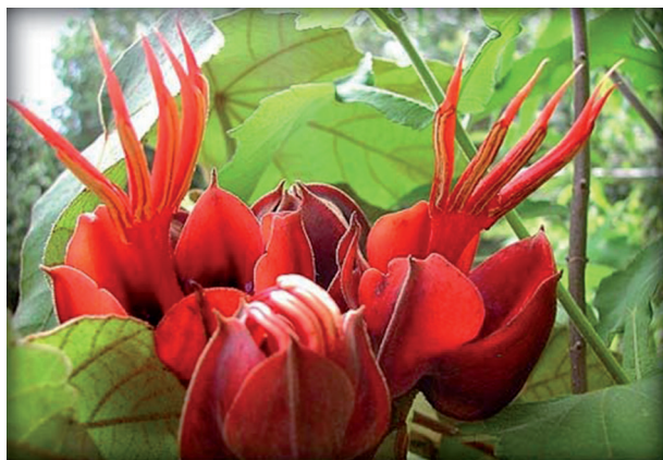
Ryc. 19. Chiranthodendron pentadactylon (nahua) Macpalxochiquauhtl – kwiat ręka. Kwiaty z ogrodów Netzahualcoyotla