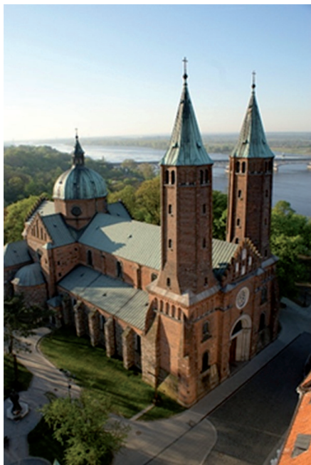
Ryc. 5. Obecny widok katedry – Katedra płocka, widok z dzwonnicy