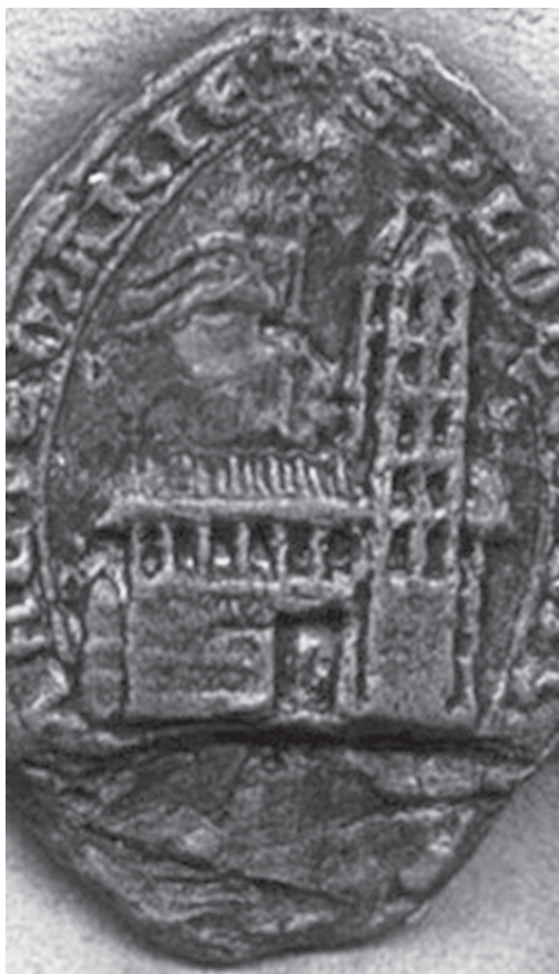
Ryc. 6. Katedra płocka na pieczęci średniowiecznej; pieczęć na dokumencie z 1289 r. z napisem: + S[IGILLUM] PLOCENSIS [ECCLESIE] S[ANTE] + MARIAE)