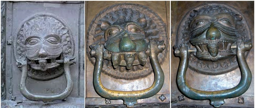
Ryc. 4. Antaby „Drzwi Płockich”