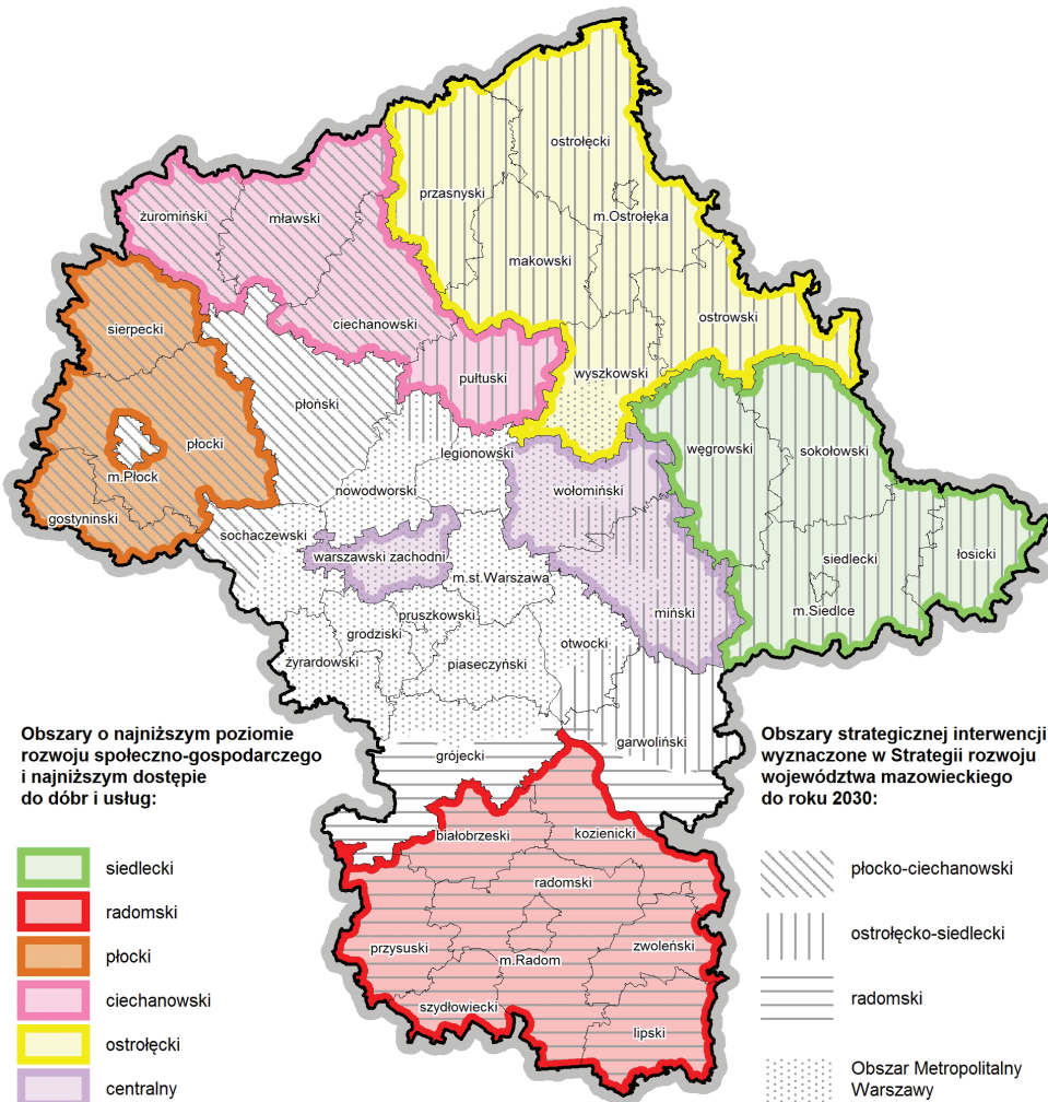
Ryc.1. Obszary problemowe województwa mazowieckiego