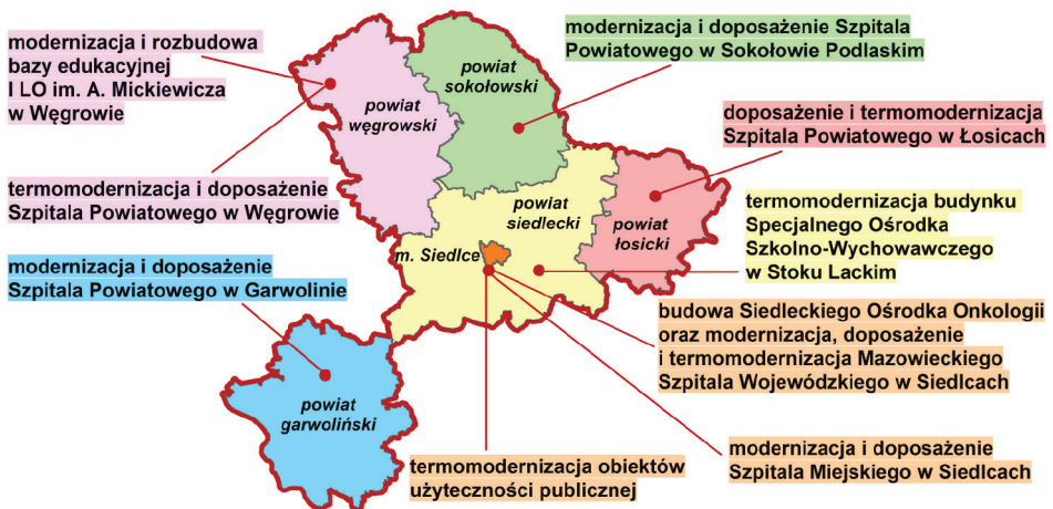
Ryc. 3. Zakres inwestycji w II wiązce projektów dla subregionu siedleckiego