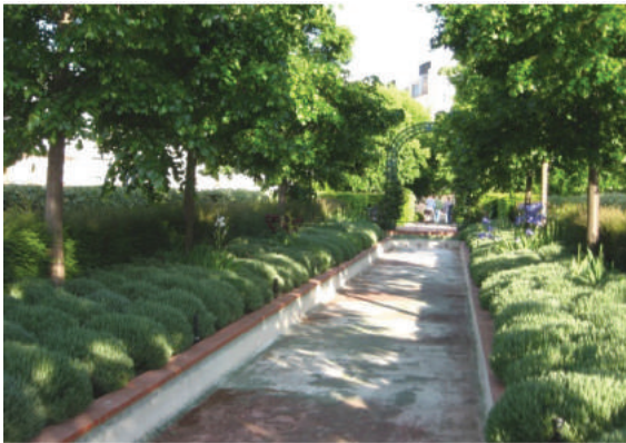
Fot. 1. Park Promenade Planteée w Paryżu