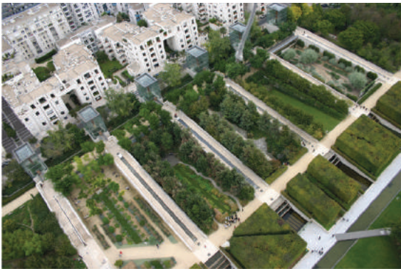
Fot. 6. Park André Citroën w Paryżu