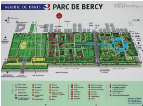
Fot. 10. Park Bercy w Paryżu