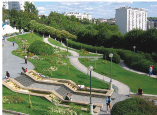
Fot. 15. Park Belleville w Paryżu

Park zrealizowany został poza śródmieściem Paryża w XX dzielnicy, poza Bulwarem Periferic – obwodnicą Paryża. Nie mieści się na schemacie planu miasta Paryża (ryc. 1). Kierunek oznaczono cyfrą 4. Jest to obszar, gdzie już w latach 70. XX w. wyburzono całe kwartały kamienic, typowych dla miasta i przedmieść przemysłowych, nieprzyjaznych dla człowieka, pozbawionych światła i zieleni. W ich miejscu powstała nowa zabudowa. Park stworzono w miejscu dawnej kopalni