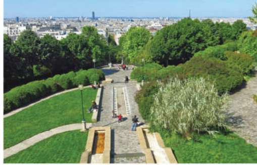
Fot. 16. Park Belleville w Paryżu