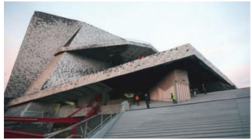
Fot. 14. Filharmonia, Park Villette w Paryżu