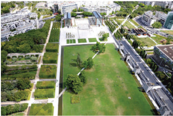
Fot. 5. Park André Citroën w Paryżu