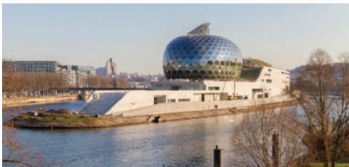
Fot. 18. Centrum Muzyki na wyspie Seguin z parkiem na dachu