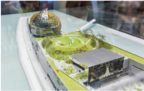
Fot. 17. Centrum Muzyki na wyspie Seguin z parkiem na dachu