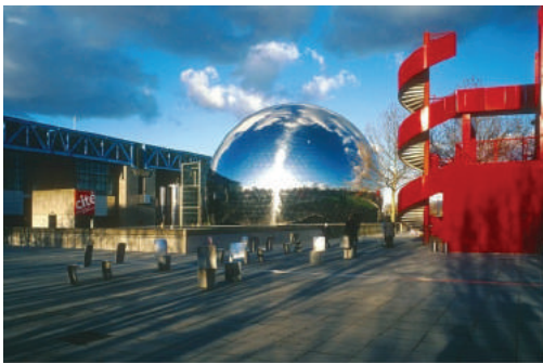
Fot. 12. Park Villette w Paryżu