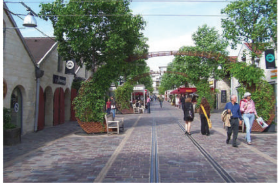
Fot. 7. Park Bercy w Paryżu

Park ten znajduje się w południowo-wschodniej części miasta, w XII dzielnicy w sąsiedztwie znanej hali sportowej, w pobliżu Sekwany, na jej brzegu północno-wschodnim. Na planie Paryża (ryc. 1) oznaczono go cyfrą 6. Było to niegdyś przedmieście przemysłowo-składowe. Zachowano budynki dawnych składów win wykorzystując je na sklepy, restauracje, kawiarnie, galerie sztuki i biura. Uliczka biegnąca między dwoma szeregami tych budynków – dawna bocznica kolejowa stała się atrakcyjnym ciągiem spacerowym. Wyposażono ją bogato w zielen, wiklinowe ławki – kosze połączone łukowatymi pergolami. (fot. 7). W parku wyeksponowano fragmenty dawnych nawierzchni ulic: bruk i urządzenia infrastruktury technicznej – żeliwne kłapy włazów i szyny tramwajowe. Stworzono kopiec – górkę widokową. Powierzchnia parku wynosi 13 ha. Wykonany został zgodnie z koncepcją francuskiego projektanta Iana Le Caisne'a. Zachowano poprzeczne alejki składów odchodzących od Sekwany oraz istniejący starodrzew ponad 500 platanów. Kompozycja przestrzenna została zbudowana na kanwie prostokątnych podziałów (fot. 8),