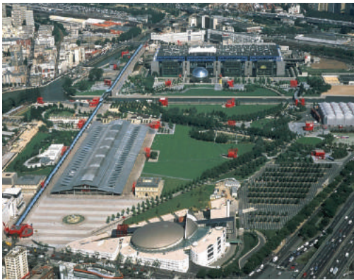
Fot. 11. Park Villette w Paryżu