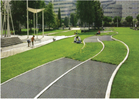
Fot. 4. Park Atlantycki w Paryżu