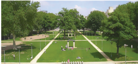
Fot. 8. Park Bercy w Paryżu