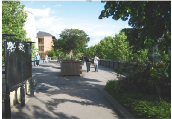
Fot. 2. Park Promenade Planteé w Paryżu

tego, że kilkanaście metrów niżej znajdują się perony dworcowe. O kierunku odjeżdżających stąd pociągów – ku wybrzeżu oceanu, przypominają elementy wyposażenia parku, kojarzące się ze statkami i morzem. Są to stalowe maszty latarni, pergoli i ogrodzeń, drewniane pomosty i tarasy słoneczne z desek, przypominające pokłady statków zapraszające do wypoczynku, symboliczne łodzie i klify. Jest także „falujący” trawnik o powierzchni 0,6 ha. Całość dopełniają różne gatunki roślinności wydmowej, traw i trzcin, które poruszane wiatrem, wydają się powierzchnią wzburzonego oceanu. Powstała oaza zieleni w centrum wielkiego miasta, przestrzeń publiczna o funkcji rekreacyjnej, bardzo chętnie odwiedzana przez mieszkańców Paryża i przez turystów. Nowa funkcja nie zastąpiła ani nie wykluczyła funkcji starej. Dworzec nadal funkcjonuje, ukryty poniżej parku, a w przestrzeni między poziomem peronów i powierzchnią parku wygospodarowano kilka kondygnacji parkingów. Jest to znakomity przykład warstwowego wykorzystania cennych terenów śródmiejskich, gdzie nie