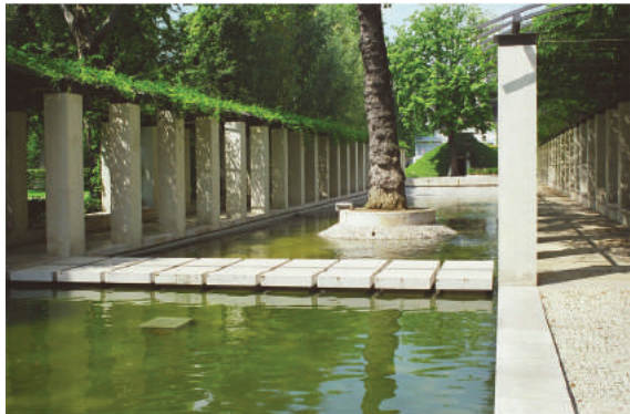
Fot. 9. Park Bercy w Paryżu