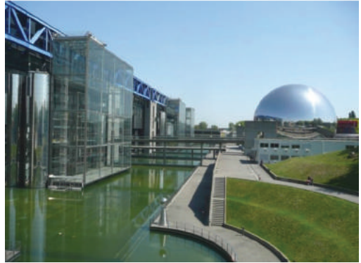
Fot. 13. Park Villette w Paryżu

mgły, winorośli. Charakterystycznym elementem jest obejmująca cały obszar parku siatka folies, czyli czerwonych obiektów – kiosków o różnych funkcjach, tworząca regularne kwadraty (fot. 11 i 12). Na terenie parku zlokalizowano nowe obiekty kubaturowe: halę widowiskową Zenith na 6 tys. miejsc, Muzeum Nauki i Techniki, otoczone sztucznym akwenem (fot. 13), kino sferyczne „La Geode” w postaci lustrzanej kuli o średnicy 36 m, która wydaje się unosić nad lustrem wody (fot. 12). W drugim etapie, po 1995 r., wzniesiono dwa obiekty: Konserwatorium i „Świat Muzyki”, zawierające sale koncertowe autorstwa Christiana de Portzamparc. Najnowszym obiektem z 2015 r. jest zlokalizowany w pobliżu hali Zenith budynek filharmonii autorstwa słynnego francuskiego architekta Jeana Nouvela (fot. 14). Architekt nie przybył na uroczystość otwarcia filharmonii, w proteście przeciwko zmniejszeniu środków finansowych, niezbędnych do zakończenia projektu zgodnie z wizją artysty.