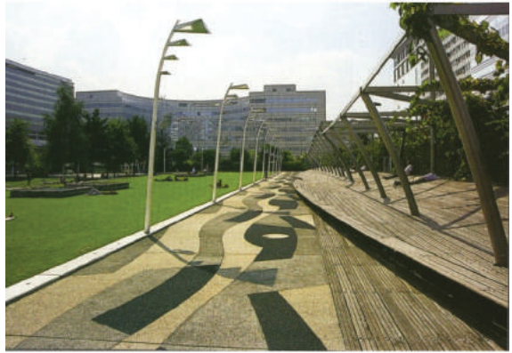
Fot. 3. Park Atlantycki w Paryżu