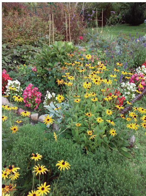
Fot. 3. ROD „Park Dolny” na Żoliborzu Fot. B. Jaworska-Księżak, lato 2018

Ogrody działkowe, niezwykle pieczołowicie pielęgnowane przez uprawiających je ogrodników-amatorów, stanowią niezwykle cenne zasoby przyrodnicze miasta. W sąsiedztwie ogrodów działkowych, podobnie jak w pobliżu parków miejskich, zauważono znacznie wyższą jakość środowiska, mniejsze zanieczyszczenie powietrza, niższą temperaturę w dni upalne (są to „wyspy chłodu” na mapie miasta), wyższą wilgotność, korzystniejszy dla zdrowia i kondycji człowieka mikroklimat. Bogactwo gatunków roślin, bioróżnorodność ogrodów działkowych, wpływają na poprawę jakości powietrza poprzez zdolność do pochłaniania dużej ilości szkodliwych gazów (tlenków siarki, siarkowodoru, dwutlenku węgla), rzędy wysokich drzew, pasy i grupy krzewów znacznie redukują natężenie hałasu miejskiego, chronią przed wiatrem. Wykazano, że zawartość bakterii chorobotwórczych, szkodliwych gazów i pyłów