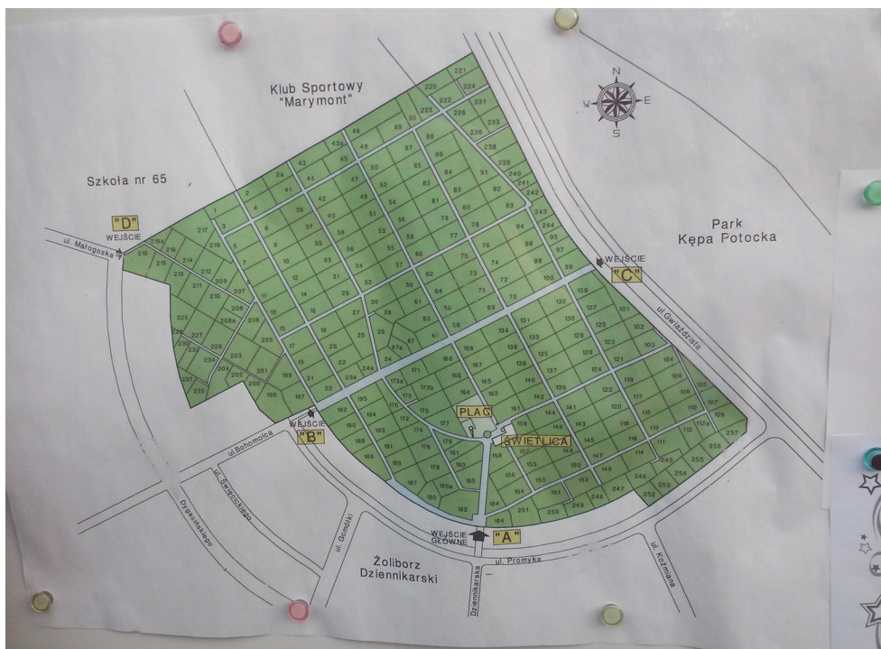
Fot. 1. Plan Rodzinnego Ogrodu Działkowego „Park Dolny” na Żoliborzu Fot. B. Jaworska-Księżak, lato 2018