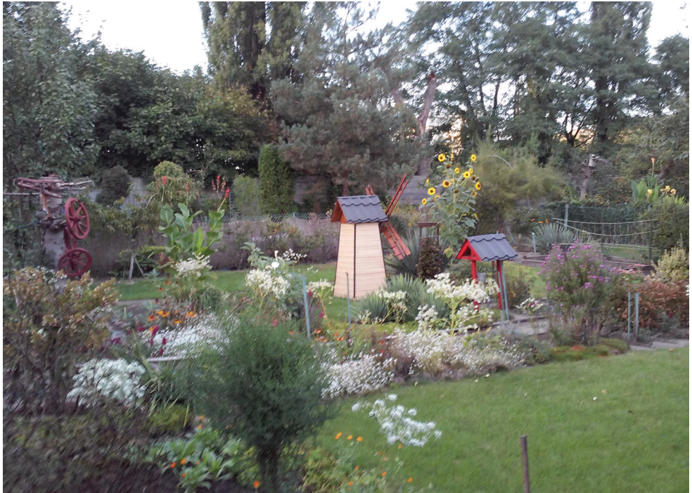
Fot. 4. ROD „Park Dolny” na Żoliborzu lato 2018

Niestety, pomimo wyraźnych społecznych oczekiwań, rodzinne ogrody działkowe, tak jak i inne tereny zieleni, są coraz mniejsze obszarowo, coraz rzadsze w krajobrazie miasta. Dotyczy to szczególnie, ze względów ekonomicznych, osiedli nowo powstających. W rezultacie mieszkańcom Warszawy zaczyna coraz dotkliwiej brakować terenów wypoczynkowych, obszarów pokrytych zielenią, wyróżniających się bogactwem przyrodniczym, pełniących ważne funkcje ekologiczne i społeczne. Stopniowa parcelacja ogrodów, redukcja ich powierzchni z myślą o zabudowie, niekorzystnie wpływa na