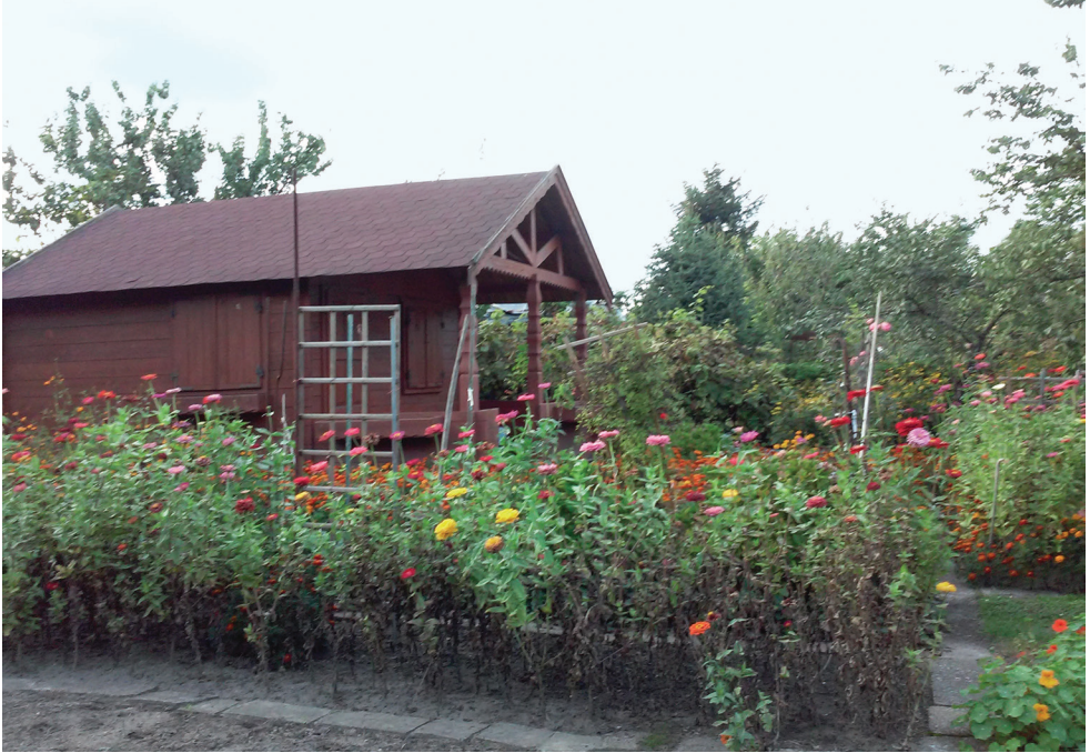
Fot. 2. ROD „Park Dolny” na Żoliborzu Fot. B. Jaworska-Księżak, lato 2018

działkowego wymusza od inwestora zapewnienie terenu zastępczego o porównywalnej wartości, w praktyce jednak oferowane są lokalizacje peryferyjne, źle z centrum miasta skomunikowane, często w mało estetycznym dla wypoczywających otoczeniu i krajobrazie.